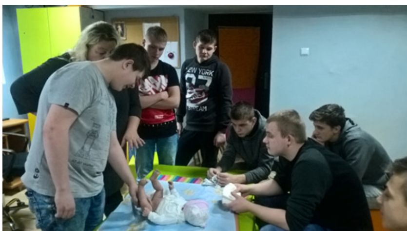
Fot. Część praktyczna warsztatów tacierzyńskich

Część teoretyczna jest bazą do trudniejszej części Programu. W trakcie warsztatów praktycznych z wykorzystaniem modeli noworodka zostają przećwiczone podstawowe czynności związane z pielęgnacją noworodka m.in. przewijanie, ubieranie, podnoszenie, karmienie, usypianie. To, co uczestnikom wydaje się w pierwszym momencie zupełnie niezrozumiałe i trudne, staramy się przybliżyć, przećwiczyć i przedyskutować podczas zajęć. Umożliwiamy młodzieży faktyczne dotykanie problemów i zagadnień, co pozwala jej na lepsze ich zrozumienie. Wykorzystując specjalne lalki demonstracyjne, pozwalamy uczestnikom samodzielnie dochodzić do pewnych wniosków. Zajęcia tworzą szansę autentycznej refleksji nad poruszonymi problemami.