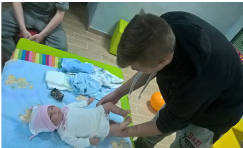
Fot. Część praktyczna warsztatów tacierzyńskich

Podczas kolejnych miesięcy wdrażania warsztatów tacierzyńskich w Ośrodku, wielokrotnie zapraszano nas na konferencje i spotkania dotyczące dzielenia się doświadczeniami w zakresie pracy z młodzieżą, Program wówczas cieszył się dużym zainteresowaniem, pojawiało się wiele pytań dotyczących takiej formy pracy. Dzielimy się zarówno naszym Programem, jak również wskazówkami do pracy z dyrektorami oraz pedagogami innych ośrodków, którzy próbują swoich sił w prowadzeniu podobnych zajęć.